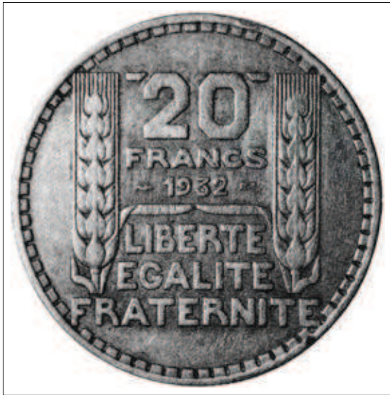
20 Francs 1932

L a 20 Francs 1932 n'est pas censée exister car absente des tableaux récapitulatifs de la production de 1932. Pourtant un exemplaire a été vu, en 1991, par Michel Prieur et a été officiellement expertisé par Alain Weil et la Monnaie de Paris [NC N°204, p.21]. Toutefois les observations plus récentes de trucages avérés réalisés pour faire des 20 Francs 1939 ou des 10 Francs 1936 ont montré un degré de réalisation tel qu'ils auraient pu abuser des collectionneurs expérimentés et des experts. De ce fait, la ligne avait été retirée, par prudence, du Franc 10 .